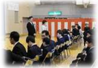
【小・中学部入学式 入場】