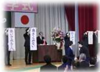
【高等部入学式 校長式辞】