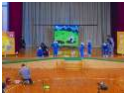
小学部 低学年 練習 光明祭の

来月の光明祭で、それぞれの学部の児童生徒たちが、大きな「実りの秋」を迎えられるよう取り組んで参りますので、温かい応援と御協力をどうぞよろしくお願いいたします。