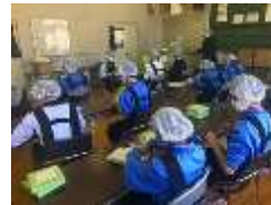
高等部 就業体験実習 (委託作業)