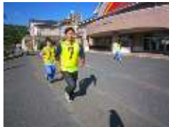
中学部 (3学年B)持久走 大会